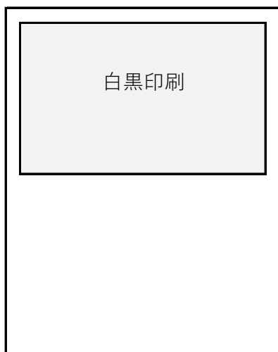
③パンフレット内1/2ページ