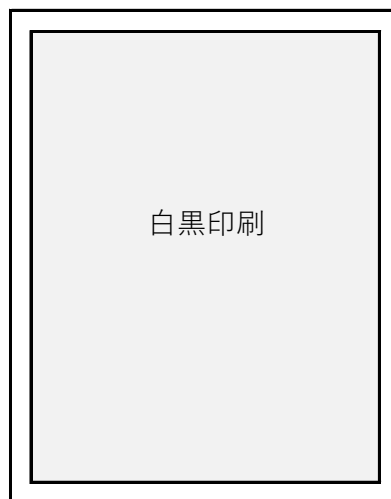
②パンフレット内1ページ