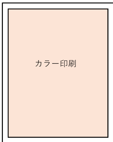
①パンフレット内1ページ